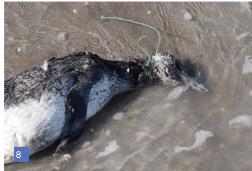
7. Lobo marino de dos pelos afectado por basura. Fundación Mundo Marino.