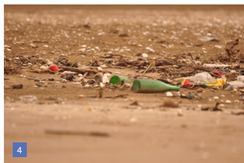
3 - 4. Basura en playas de San Clemente del Tuyú.