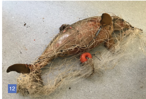
11 - 12. Franciscanas atrapadas en redes fantasma. Fundación Mundo Marino. 2018