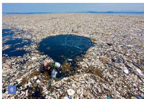
5. Ubicación de islas basura. Modelo referencial.