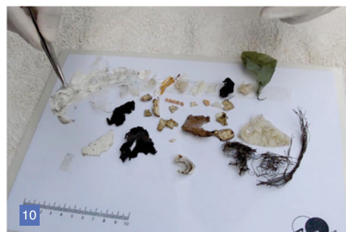
9. Tortuga defecando basura. Fundación Mundo Marino.