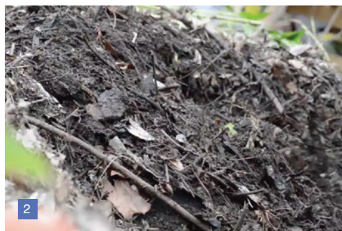
1 - 2. Compostera. Mundo Marino.

Estamos acostumbrados a meter todos esos objetos que ya no nos sirven en bolsas plásticas negras que posteriormente se lleva el camión de la basura. ¿Pero alguna vez, te preguntaste a dónde va esa basura? En las ciudades la basura puede llegar a 3 destinos probables: microbasurales, vertederos ilegales (o basurales a cielo abierto) y rellenos sanitarios.